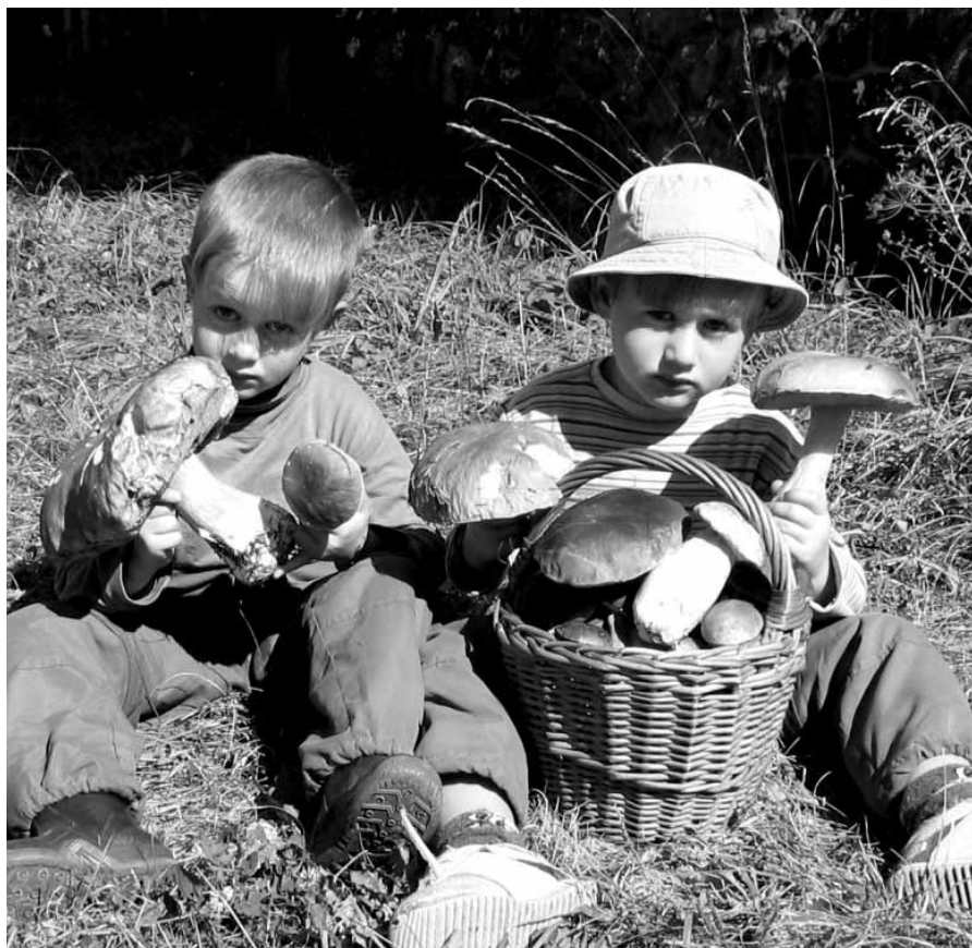
A potom, že nerostou...