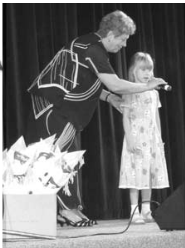
Druhého září bylo v Lidovém domě slavnostně přivítáno 34 prvňáčků.