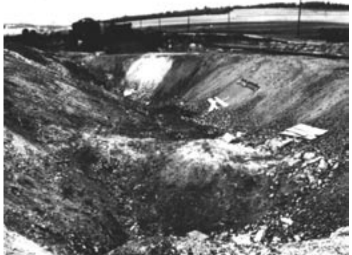
jáma v kolejišti po výbuchu muničního vlaku

Až na konci války, kdy už bylo málo lokomotiv, dva transporty uvíznuly ve staňkovském nádraží. Odstavili je na poslední koleje blízko k viaduktu silnice do Osvráčina. Nikdo, ani děti, k vagónům nesměl. Ale z dálky jsme viděli, jaký je nepořádek kolem vagónů, že kdo byl schopen, vystoupil, udělal potřebu a zase nastoupil. Neviděli jsme, zda jim dávali jídlo. Jen občas přijelo auto a mrtvé odvezlo. Jenže nestačilo nádraží. Skončil provoz trati do Poběžovic a tam odstavili další transporty.