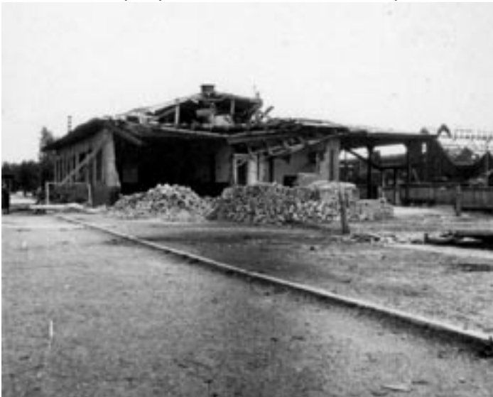
holýšovské nádraží krátce po bombardování

Až se to stalo! Jeden večer začaly kolísavě houkat sirény. Letecký poplach! U nás v domě ještě nebyly kryty, a tak všichni se běželi schovat do Čermenského lesíku. Slyšeli jsme zdáli směrem na Plzeň slabé výbuchy. Nebe se tam rozzářilo křížovaně pohybujícími se jasnými pruhy světlometů. Ve výšce jsme viděli i osvětlená letadla. Nebylo to až tak daleko.