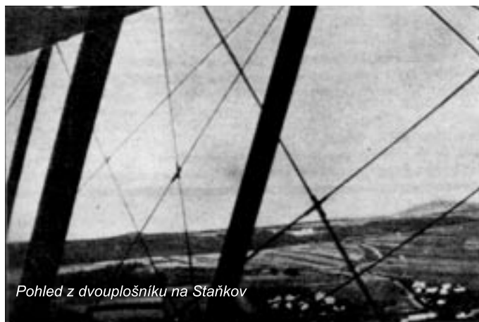
Pohled z dvouplošniku na Staňkov