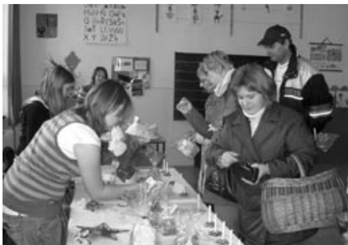
V úterý 25.11. proběhla v budově ZŠ Staňkov prodejní vánoční výstava výrobků žáků školy.