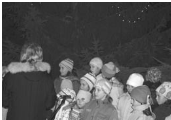
V podvečer první adventní neděle se za zpěvu koled staňkovských dětí rozsvítil na náměstí vánoční strom.