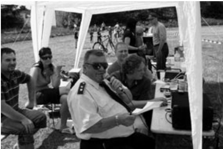
Na zdárném průběhu se podílely bývalé i současné opory staňkovských hasičů - moderoval p. Neznámý...

23. května se uskutečnil již 7. ročník soutěže v požárním útoku O pohár města Staňkov na louce za požární zbrojnicí. Bylo pěkné počasí. Soutěžila 2 družstva žen a 5 družstev mužů. Poměrně malá účast byla způsobena tím, že ve stejném termínu probíhaly hasičské okrskové soutěže v okolí. Každé družstvo měla dva pokusy, vyhrály ženy z Poděvous před ženami z Křenov, z mužů byli nejlepší hasiči z Vřeskovic před mužstvem z Křenov, třetí se umístilo družstvo pořadajícího sboru SDH Staňkov, následovalo družstvo z Vránova a Ohučova. Vítězové obou kategorií si putovní poháry odvezli domů, protože zvítězili potřetí.