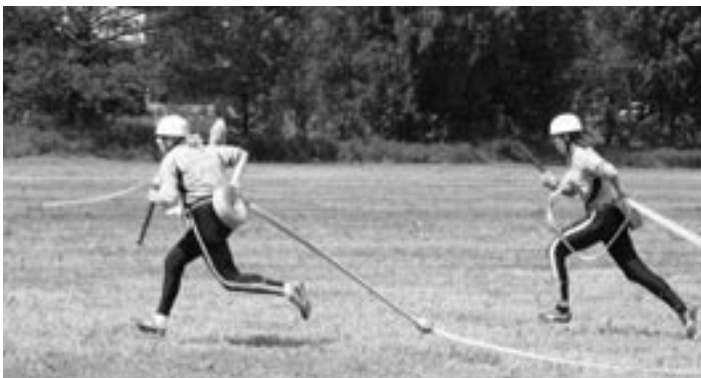
Útok děvčat z Poděvous

23. května se uskutečnil již 7. ročník soutěže v požárním útoku O pohár města Staňkov na louce za požární zbrojnicí. Bylo pěkné počasí. Soutěžila 2 družstva žen a 5 družstev mužů. Poměrně malá účast byla způsobena tím, že ve stejném termínu probíhaly hasičské okrskové soutěže v okolí. Každé družstvo měla dva pokusy, vyhrály ženy z Poděvous před ženami z Křenov, z mužů byli nejlepší hasiči z Vřeskovic před mužstvem z Křenov, třetí se umístilo družstvo pořadajícího sboru SDH Staňkov, následovalo družstvo z Vránova a Ohučova. Vítězové obou kategorií si putovní poháry odvezli domů, protože zvítězili potřetí.