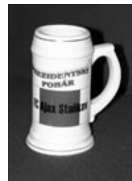
Tento korbel věnovali futsalisté svému dlouholetému šéfovi