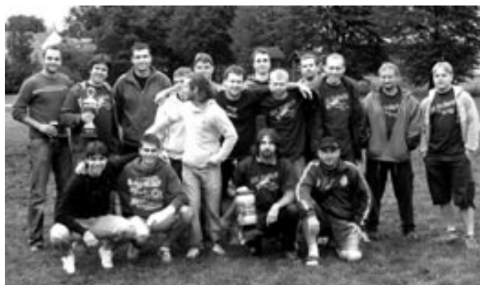
Část účastníků setkání Ajaxu Staňkov 18.7. v Hlohové