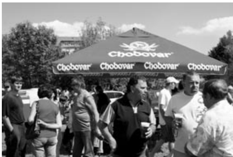
Hasilo se nejen vodou ze stříkaček.