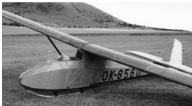
Zlín Z-24 Krajánek