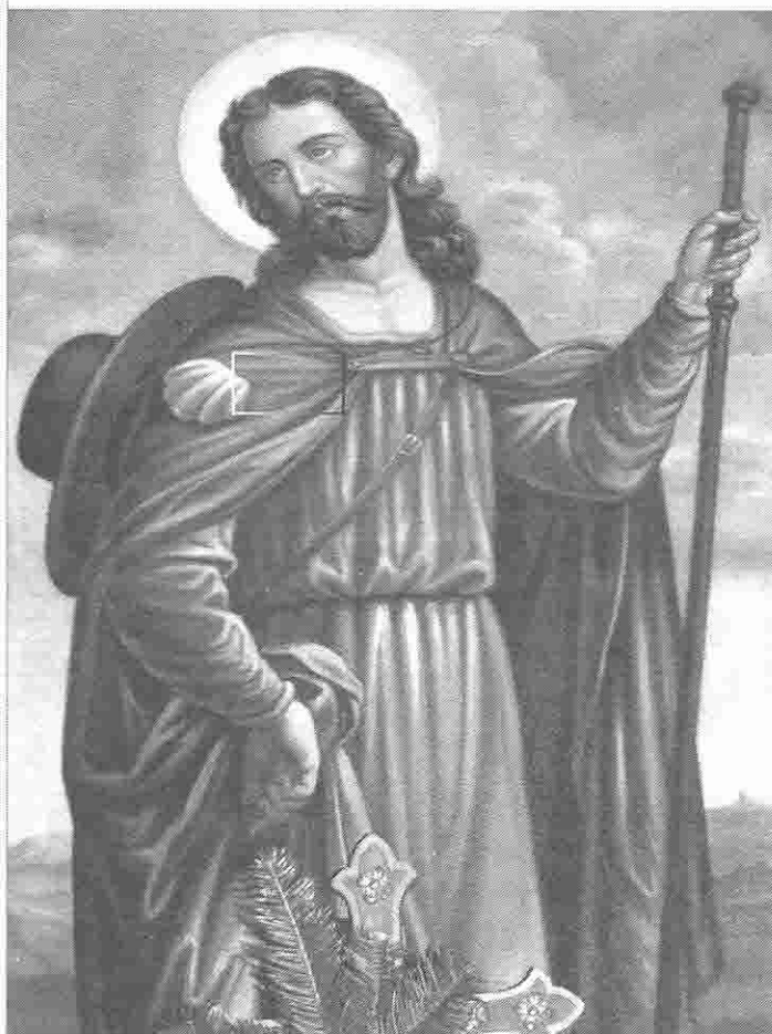
Svatý Jakub Starší na oltáři staňkovského kostela

Byl bratrem apoštola Jana a patřil spolu s Petrem a Janem ke zvláště privilegovanému užšímu kruhu učedníků. V době pronásledování Heroda Agrippy byl v roce 42 sťat mečem. Nad jeho hrobem v Jeruzalémě byl později postaven kostel k jeho cti. Za legendu se považuje tvrzení, že kázal ve Španělsku a že tam byly přeneseny i jeho ostatky. Od 10. století započala velká vlna poutí do Santiaga de Compostela k jeho hrobu a přispěla k tomu, že světec se stal velmi populárním. Staňkov se svým kostelem sv. Jakuba je na cestě tohoto putování do Španělska. Cílem takového putování je vždy hlubší, osobnější setkání s Bohem v modlitbě. Lidi na pouť přivádí touha svěřit se Bohu, Panně Marii, sv. Jakubovi i s vlastními strastmi a vyprosit si útěchu, světlo, sílu a pomoc, vyslyšení v naléhavých záležitostech. S tím pak samozřejmě souvisí i vděčnost.