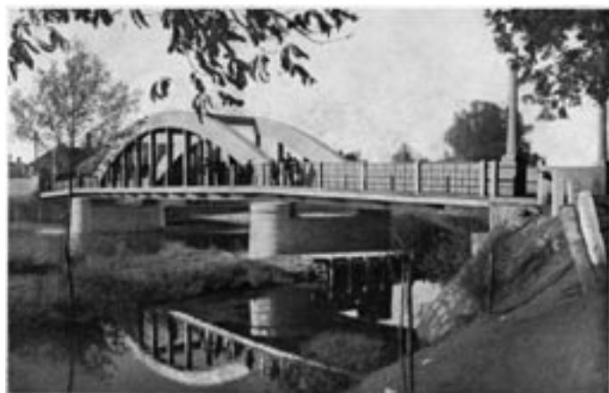
BEŤONOVÝ MOST (zpracoval dr. Ing. E. Viktor a Prasky, stavěla dr. Müller a Kapsa a Příměl).

stavěli. Staňkovští dokonce prohlašovali, že most slouží především horšovskotýnským poddaným (obyvatelé Městyse Staňkova byli poddanými kláštera v Chotěšově) a jim samým zcela dostačuje lávka pro pěší. Dále vytykali vrchnosti v Horšovském Týně, že zrušila starodávný most u Vránova. Spor řešil krajský úřad v Klatovech i v Plzni a bylo rozhodnuto o povinnosti Městyse postarat se o znovuzprovoznění mostu. Obec se nezdala a odvolala se k zemskému guberniu, které v srpnu 1820 učinilo rozhodnutí o rozdělení nákladů na opravu mezi obě znesvářené strany.